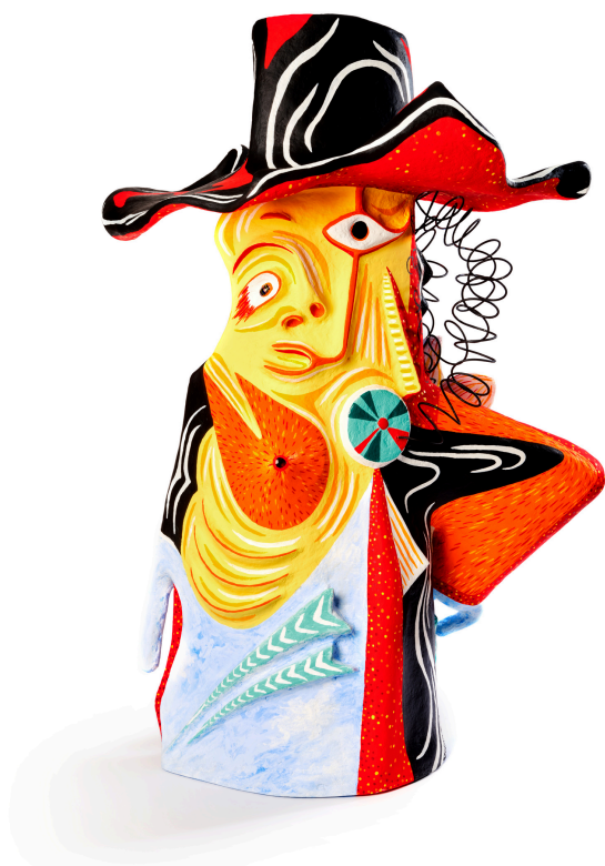
Wabé En Avignon, 2022 Papier mâché, acrylique