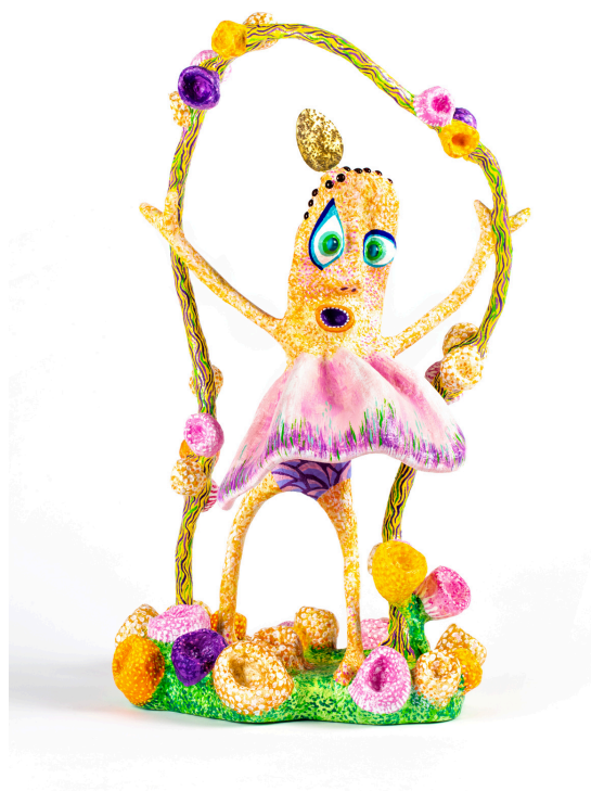
Wabé Libre et forte, 2021 Papier mâché, acrylique