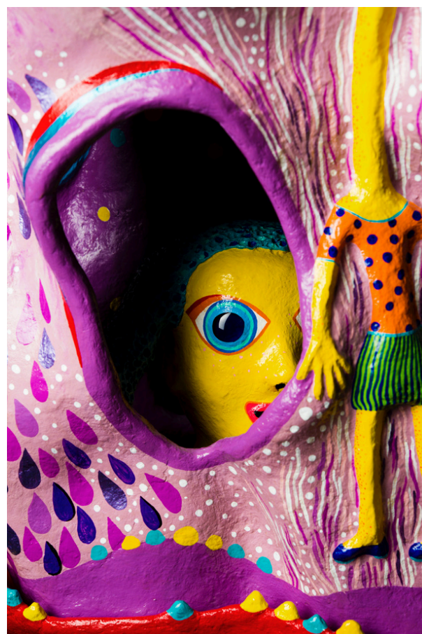
Wabé La chute d'Alice, 2011 Papier mâché, acrylique