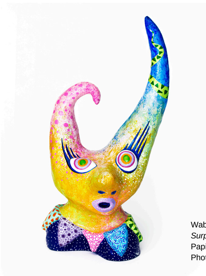
Wabé Surpris par la nuit, 2019 Papier mâché, acrylique